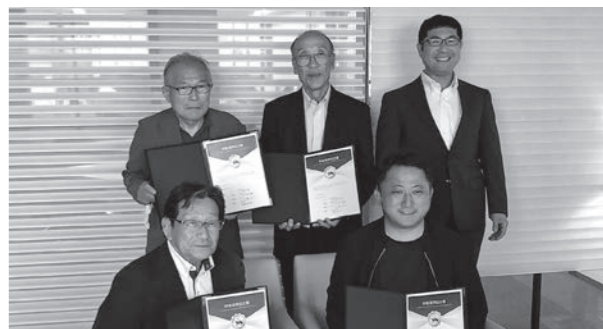
写真1. コントラクターと大規模酪農法人の耕畜連携協定式(酪農法人グループ本社 北海道帯広市にて)